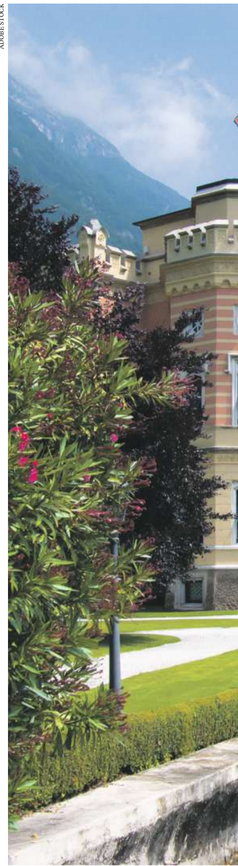
Zwischen Zitronenbäumen, Oleandersträuchern