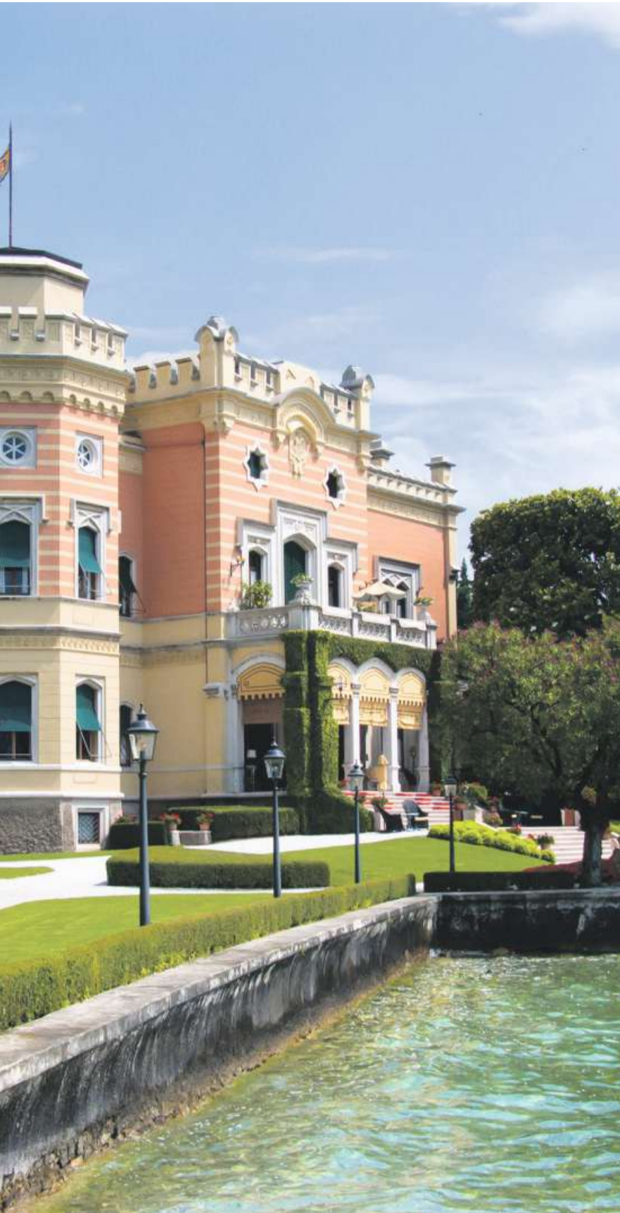
und dem leuchtenden Wasser des Gardasees liegt die «Villa Feltrinelli».